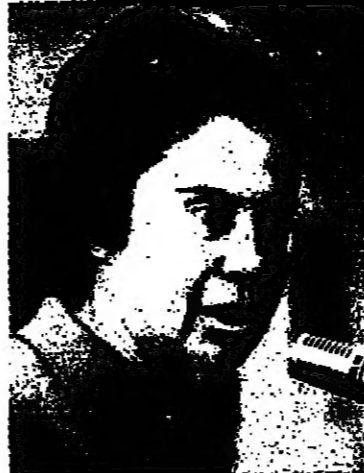
السيدة اورا نمير رئيسة لجنة المعارف والثقافة التابعة للكنيست

- بالطبع، مثلا: البحث في شؤون المدارس، ويوم التعليم الطويل، الاحتكاكات في الجامعات وتغيير برامج التعليم، وامتحانات البجروت، ومخاضات الشبيبة، الاصلاح في مبنى التعليم، وتشكيل لجنة ثانوية دائمة للتربية والتعليم في الوسط العربي. وما هي مهام هذه اللجنة؟ - تتجسد اللجنة مرة كل اسبوعين واهم المواضيع التي تعالجها الان العمل على توسيع ابنية المدارس وتغيير غرف الدراسة وذلك عن طريق التوسط لدى الوزارة، موضوع دور المعلمين والمعلمات العرب، وتحسين برامجها واستغلال النتائج، والعمل على ضمان التعليم